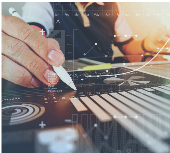
Dados Estatísticos da Indústria de Fundos Considerando todos os fundos listados na Anbima Data base: 30/06/2022

Segundo dados da Anbima e consolidados pela Consultoria Aditus, o plano FIPECqPREV superou a mediana das rentabilidades dos fundos de investimentos de previdência, normalmente vinculados aos Planos Geradores de Benefício Livre (PGBL), que apresentaram 3,92% de retorno no acumulado do ano até junho, considerando todas as categorias Anbima, contra 4,00% do FIPECqPREV.